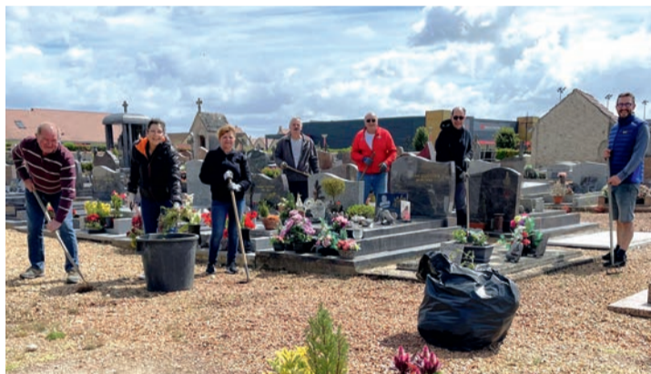
la dernière opération du 15 juin 2024

Merci à tous les bénévoles qui viennent participer.